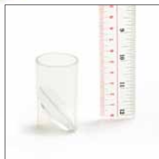
Small parts cylinder

Toys with unsafe parts that can come loose or detach do not comply with safety laws.